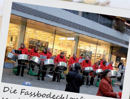
Die Fassbodechlopper sorgten für Stimmung