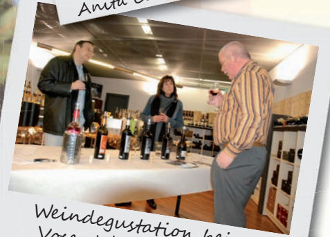
Weindegustation bei Voser Wine & Spirits