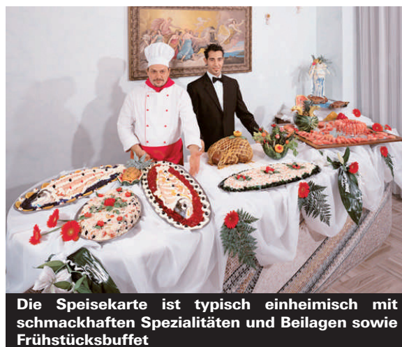
Die Speisekarte ist typisch einheimisch mit schmackhaften Spezialitäten und Beilagen sowie Frühstücksbuffet

verschiedene Erneuerungen und dieses Jahr wurden bei vielen Zimmern die Renovation der Badezimmer in Angriff genommen, neu mit Duschkabinen und neuen sanitären Anlagen. Das Hotel liegt direkt am Meer und man kann ohne überqueren der Hauptstrasse zum Strand gelangen, der zu dieser Jahreszeit noch nicht völlig überfüllt ist. Auch die Strandanlagen sind sehr sauber ausgelegt und gepflegt, wie man es sonst selten antrifft. Der Ort Gabicce Mare ist mit einer Brücke zu Cattolica verbunden und bietet eine wunderbare Umgebung für Shopping, Wandern, Flanieren oder Geselligkeit. Alle Zimmer sind modern ausgestattet mit TV, Safe und Balkon.