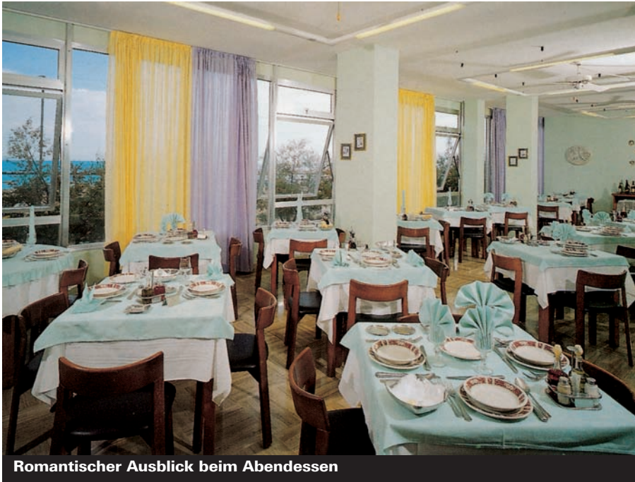
Romantischer Ausblick beim Abendessen