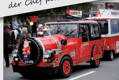
Die Festbahn durfte natürlich nicht fehlen

Auch am 20. Dezember sind wieder einige Läden aus dem Handel und Gewerbe für Sie geöffnet.