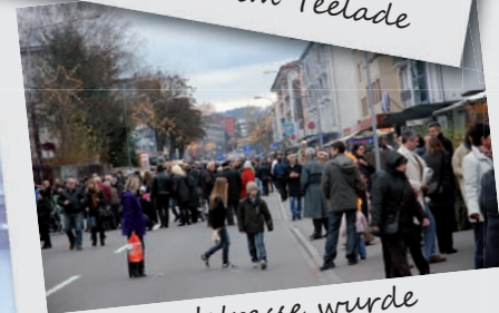
Die Landstrasse wurde zur Flaniermeile