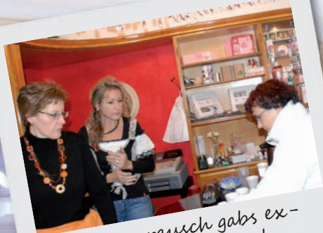
Bei Rosenrausch gabs exklusiven Rosenpunsch

Ein stimmungsvoller Rückblick auf den 1. Advent