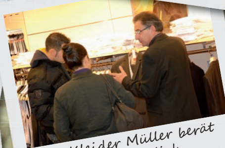
Bei Kleider Müller berät der Chef persönlich